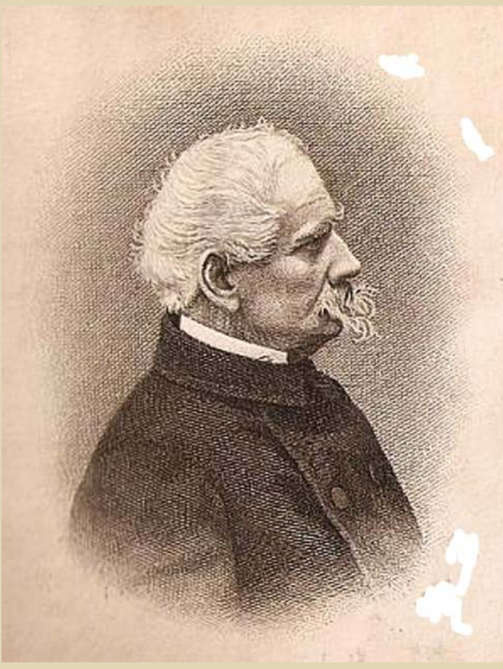
Wincenty Pol 1807-1872)

...Geograf i etnograf roztacza (...) obraz życia narodu na przestrzeni , jak dzieje dają obraz jego życia w czasie . Rezultaty naukowe tych dwóch metod postępowania powinnyby się uzupełniać wzajemnie w nauce ...