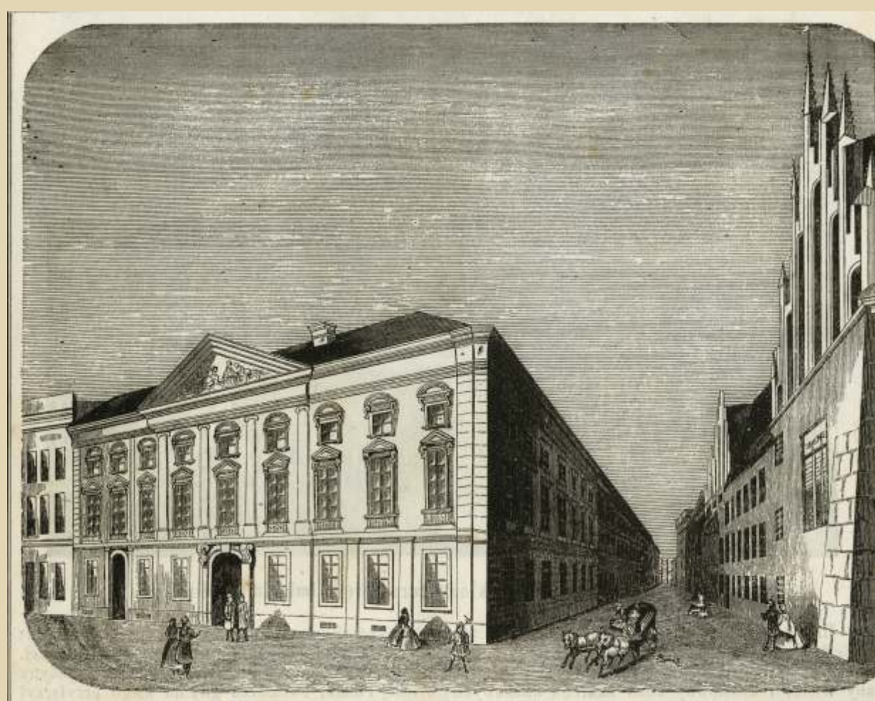
Kolegium Fizyczne w Krakowie. Kolegium Fizyczne UJ, ul. W. Anny 6 (obecnie Kolegium Kołłątaja). Siedziba katedry geografii kierowanej przez W. Pola i F. Czernego-Schwarzenberga/ The building of the College of Physics at 6 W. Anny Street (currently the Kołłątaj College). Housed the Chair of Geography under W. Pol and F. Czerny-Schwarzenberg.