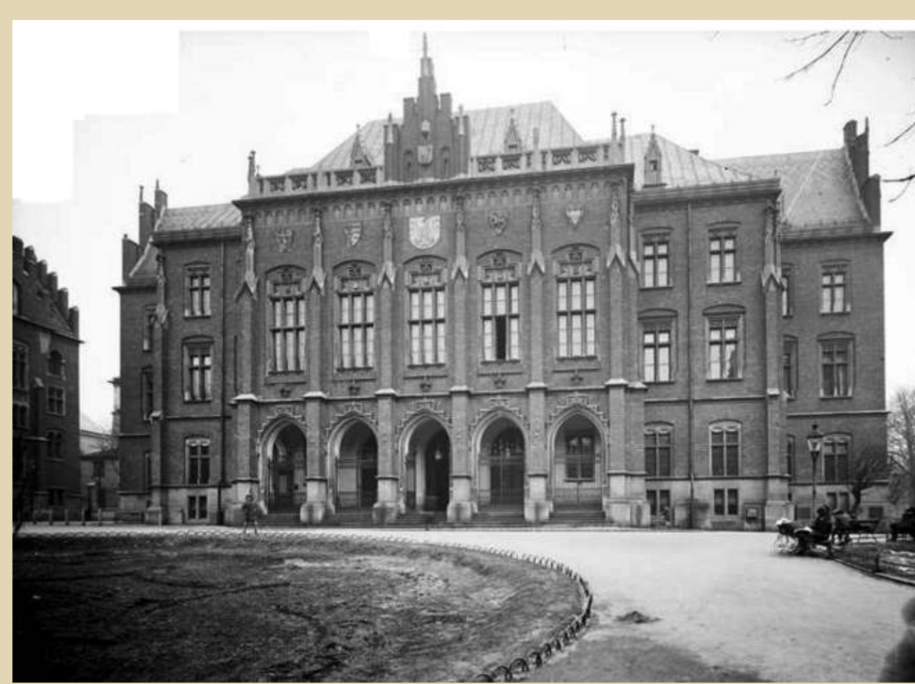
Collegium Novum UJ - budowę ukończono w 1887, w 1906 przeniesiono katedrę geografii. Widok 1925/ The Collegium Novum of the Jagiellonian University, which was completed in 1887. In 1906, the Chair was moved here.