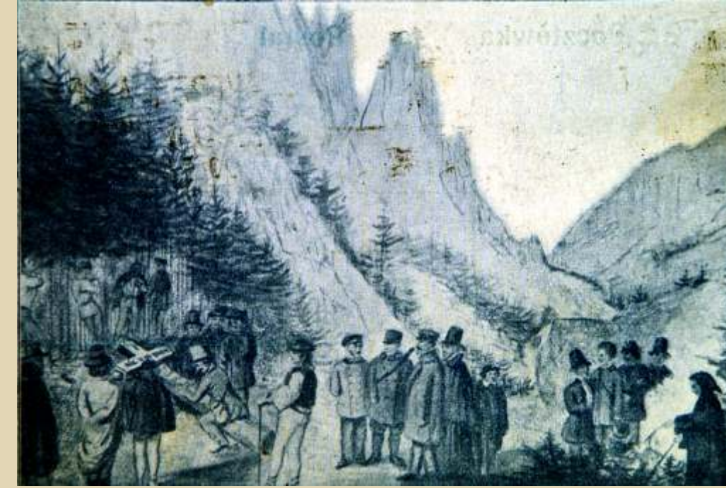
Wycieczka W. Pola ze studentami w Tatry - Dolina Kociołska (1852). Wincenty Pol's trip with students in Tatras - in the Kociołska Valley (1852).