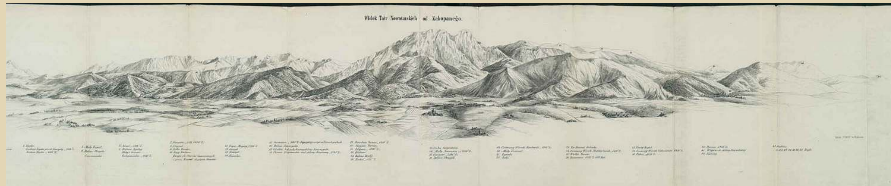
Eugeniusz Janota: Panorama górska lub widok na Tatry (1860). Janota: A mountain panorama or a view of the Tatras (1860).

1853-1877 Geographical studies continue, despite the closing of the Chair. Two doctoral titles are conferred. Eugeniusz Janota: Przewodnik w wycieczkach na Babie Górze, do Tatr i Pienin (A guide to excursions to Babia Góra, the Tatras and the Pieniny, 1860) , Feliks Berdau: Karpaty w ogóle, a w szczególności ci pod względem geograficznym, geognostycznym i botanicznym (The Carpathians in general, and in particular in the geographical, geognostic and botanical aspects, 1866) .