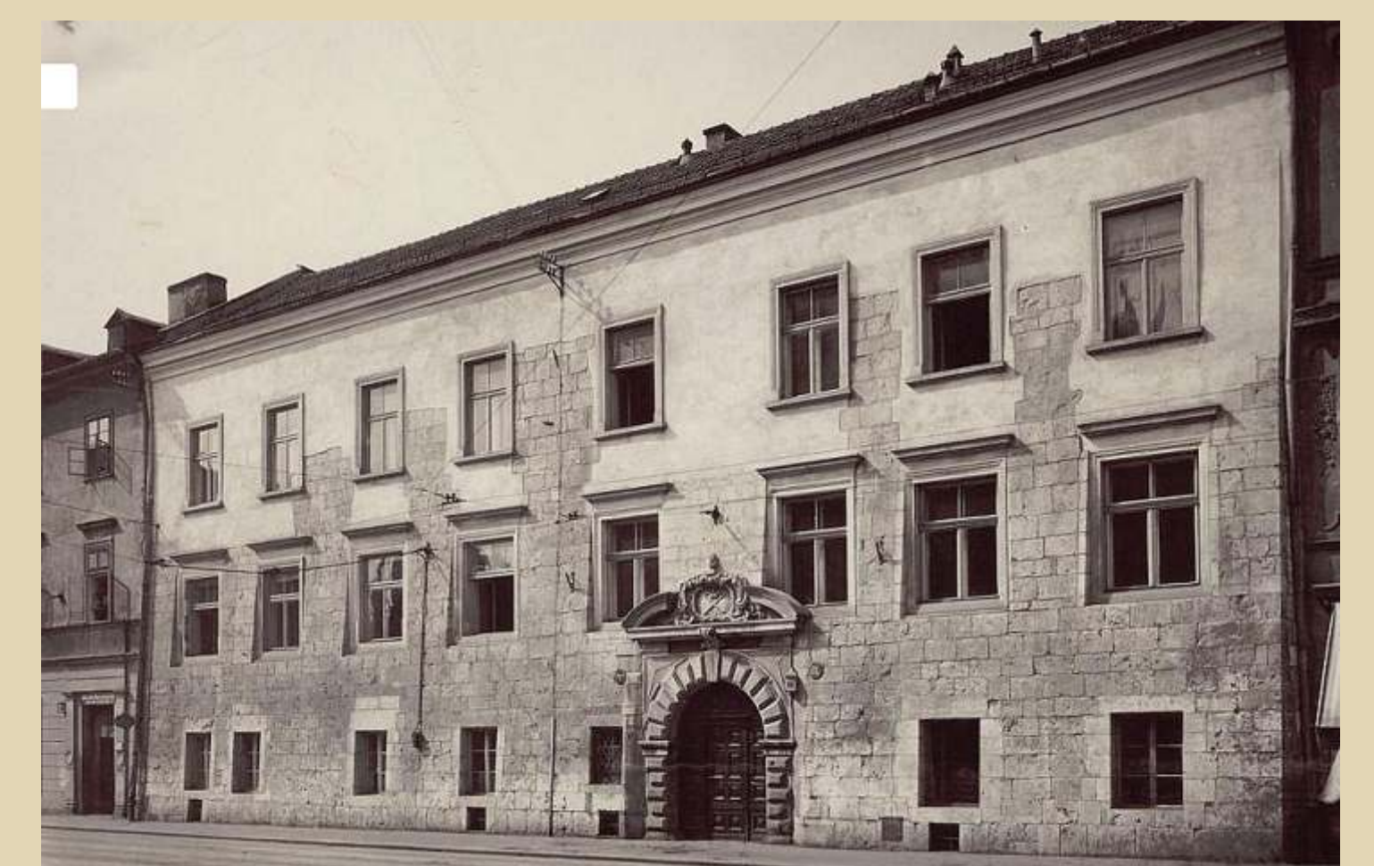
Collegium Iuridicum UJ (XIV/XV w.), ul. Grodzka 53. Od końca XIX wieku siedziba Instytutu Geograficznego. Ok. 1922 przeniesiono do Starego Arsenalu , ul. Grodzka 64/ The Collegium Iuridicum of the Jagiellonian University (14th-15th c.), 53 Grodzka Street. From the end of 1916 housed the Institute of Geography. Around 1922 the Institute moved to the Old Arsenal at 64 Grodzka Street.